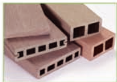
実物は写真と色合いが異なる場合があります。

世界的に地球環境保全の潮流が進む中、鈴与マテリアルでは原材料の99%以上にリサイクル資材を使用したエコ循環型新素材「エコパルマ」を開発、商品化しました。森林資源の使用を減らし、また資源の循環的利用により環境負荷の低減にも役立つエコ商品「エコパルマ」。 鈴与グループは、未来の地球のためにグループ全体を挙げてリサイクル・リユース事業の実現に取り組んでいます。